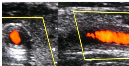
Sonographie der Gefäße: Nachweis eines Wandödems (=Halo) der Arteria carotis bei der Arteriitis temporales